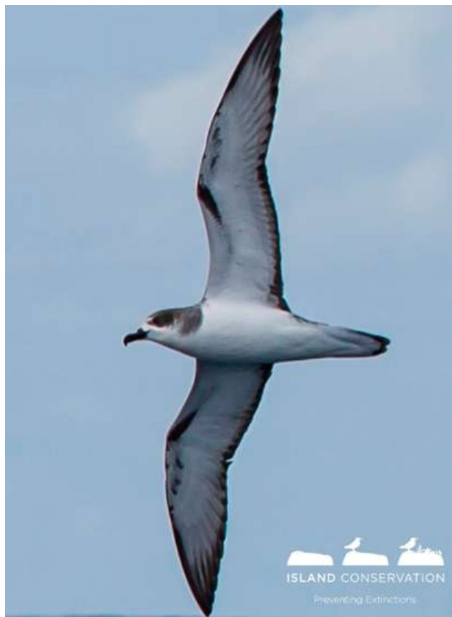
Fardela de Masafuera ( Pterodroma longirostris )