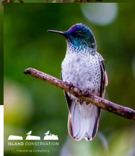
Picaflor de Juan Fernández ( Sephanoides fernandensis ) – hembra