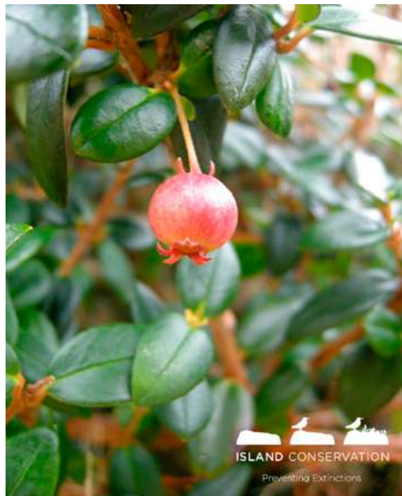
Murta ( Ugni molinae )

evaluaciones de riesgo del potencial invasor de algunas plantas exóticas según su distribución, características y comportamiento tanto en el archipiélago como en otros lugares. Estas plantas tienen alto riesgo de convertirse en invasoras prontamente si no se realiza un manejo apropiado para minimizar su establecimiento, dispersión e impacto.