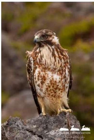
Aguilucho de Masafuera ( Geranoaetus polyosoma exsul )