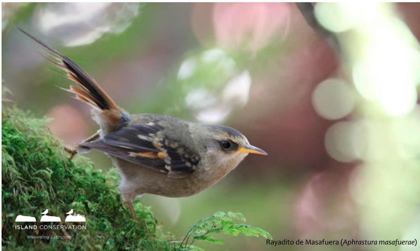
Rayadito de Masafuera ( Aphrastura masafuerae )