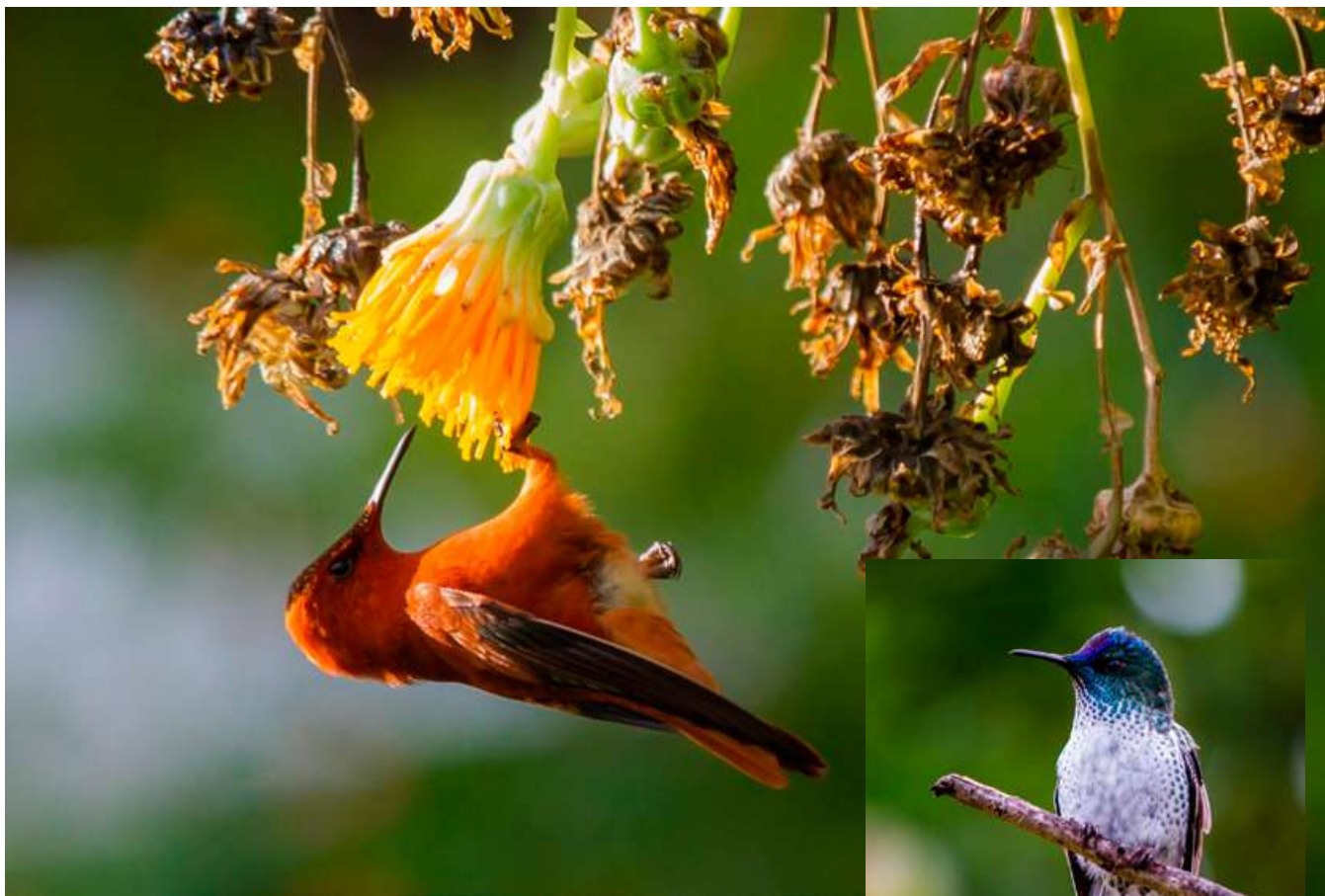
Picaflor de Juan Fernández ( Sephanoides fernandensis ) – macho