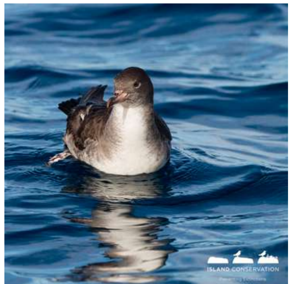
Fardela blanca ( Ardenna creatopus )

En Isla Alejandro Selkirk, el rayadito de masafuera ( Aphrastura masafuerae ), endémico de esta isla, se encuentra en peligro crítico [41] con una población que podría haber declinado hasta 140 ejemplares [44; 45]. También existe una subespecie de churrete ( Cinclodes oustaleti baeckstroemii ), una subespecie de aguilucho endémica ( Geranoaetus polyosoma exsul ) y las fardelas blanca de Juan Fernández ( Pterodroma externa ) y de Masafuera ( Pterodroma longirostris ) que son las únicas aves marinas endémicas en Isla Alejandro Selkirk [28]. Por otra parte, en la Isla Robinson Crusoe se encuentra el picaflor de Juan Fernández ( Sephanoides fernandensis ), endémico de esta isla, en peligro crítico a nivel internacional [41] y catalogado como especie en peligro y rara según el RCE [42] con una población que para el año 2005 se estimó en unos 1.100 individuos [45]. También, el cachudito de Juan Fernández ( Anaethes fernandezianus ) y el cernícalo de Juan Fernández ( Falco sparverius fernandezianus ) corresponden respectivamente a una especie y subespecie endémicas de la Isla Robinson Crusoe.