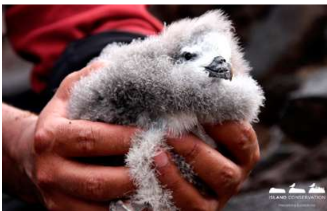
Fardela blanca de Masatierra ( Pterodroma defilippiana )