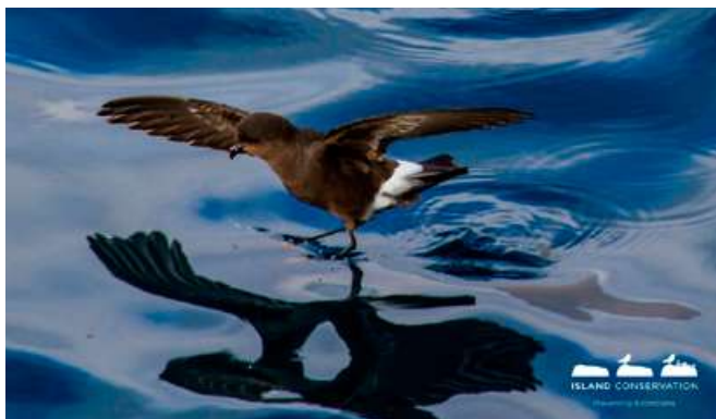
Golondrina de mar de vientre blanco ( Fregetta grallaria segethi )