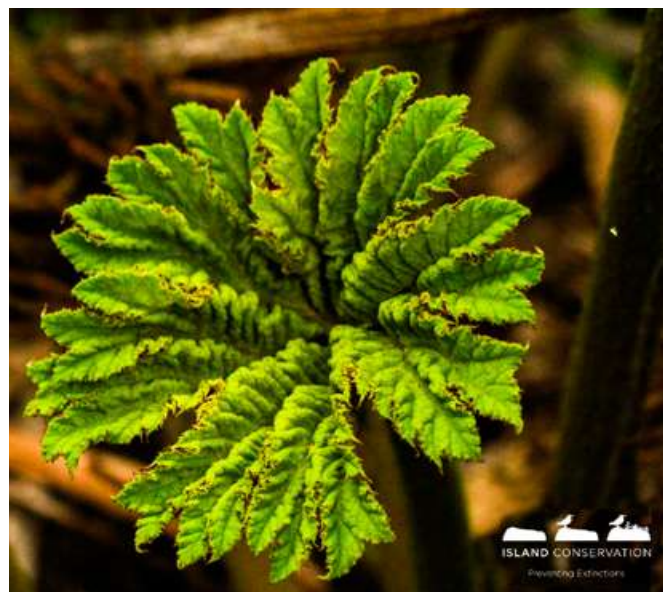
Pangue de Juan Fernández ( Gunnera peltata )