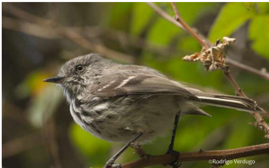
Cachudito de Juan Fernández ( Anairetes fernandezianus )