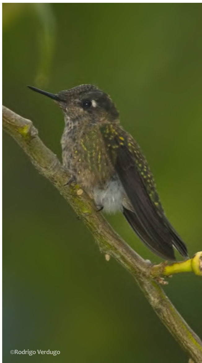
Picaflor chico ( Sephanoides Sephaniodes )