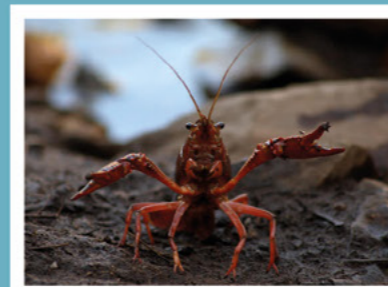
Cangrejo rojo americano